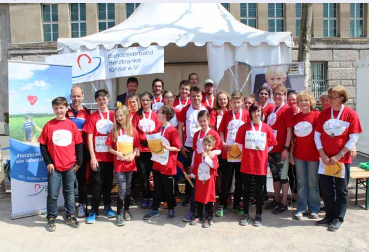
Alle sind Sieger! Verleihung der Urkunden und Medaillen an die kleinen und großen Staffelläufer.

Zu und von den Streckenabschnitten kommen die Teilnehmer selbst (Kinder mit ihren Eltern) per U-Bahn oder zu Fuß. Detaillierte Infos zu individuellen Startzeiten und –punkten bekommen Sie wenige Tage vor dem Start. Bitte planen Sie bei Ihrer Anreise ein, dass wegen des Marathons Teile der Innenstadt gesperrt sind.